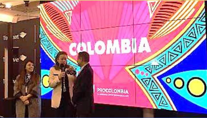
La Embajadora Jaramillo en la inauguración de la BTL

Los colombianos somos un pueblo feliz y resistente, que tiene como una de sus metas recibir de manera ejemplar y mejor los turistas portugueses que quieran visitarnos y quienes no serán indiferentes a la belleza inherente a ese magnífico país Colombia".