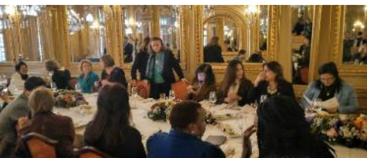
“AWA - Association of Women Ambassadors” – Restaurante Tavares Rico. Enero de 2019

La Embajadora de Colombia, Carmenza Jaramillo, en su calidad de Presidente del grupo “AWA - Association of Women Ambassadors”, organizó el primer encuentro del año 2019.