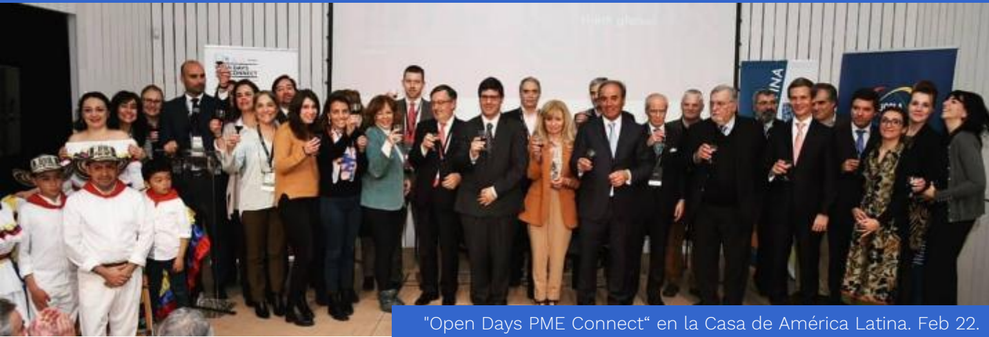
"Open Days PME Connect" en la Casa de América Latina. Feb 22.

El "Open Days PME Connect", evento de networking empresarial en el marco del proyecto PME Connect, se realizó en el auditorio de la Casa da América Latina y de la UCCLA, en Lisboa.