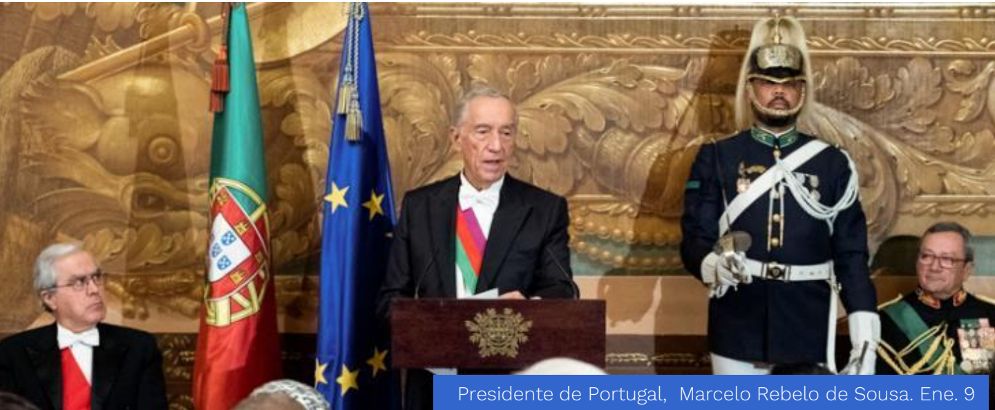
Presidente de Portugal, Marcelo Rebelo de Sousa. Ene. 9

El Presidente Marcelo Rebelo de Sousa recibió en el Palacio Nacional de Ajuda al cuerpo diplomático acreditado en Portugal, quienes presentaron el tradicional y protocolario saludo de Año Nuevo.