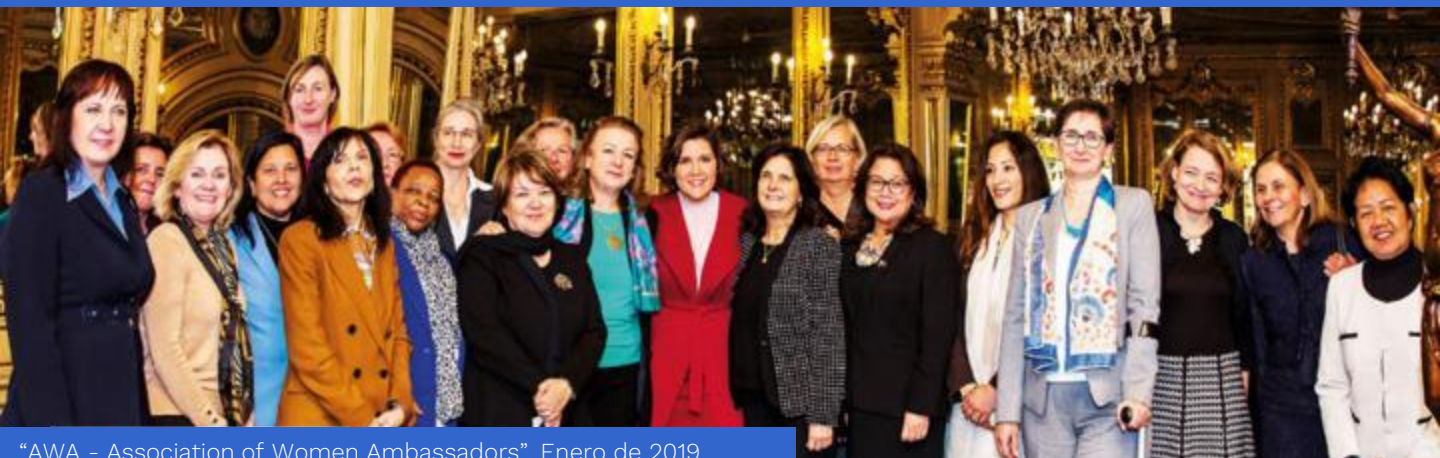
“AWA - Association of Women Ambassadors”. Enero de 2019.

La Embajadora de Colombia, Carmenza Jaramillo, en su calidad de Presidente del grupo “AWA - Association of Women Ambassadors”, organizó el primer encuentro del año 2019.