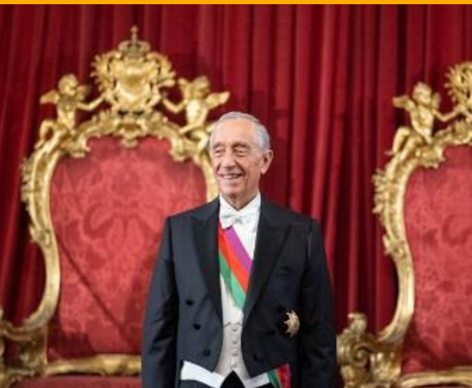
Presidente de la República Portuguesa.

La sesión de saludos al Presidente Rebelo de Sousa, en compañía del Ministro de Asuntos Exteriores, Augusto Santos Silva, y altos funcionarios del Protocolo de Estado, tuvo lugar en la Sala del Trono del Palácio.