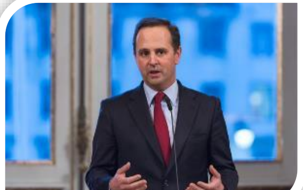
El Alcalde de Lisboa, Fernando Medina. Feb.14

En esa ocasión, el Alcalde se dirigió a los representantes diplomáticos con quien Portugal mantiene buenas relaciones y en su intervención destacó las sinergias de eventos como la WebSummit , que captó el interés de inversionistas en Lisboa, como la creación del 'Hub Creativos', para la instalación de incubadoras de empresas innovadoras y tecnológicas.