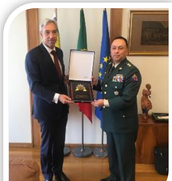
El Ministro de Defensa João Gomes Cravinho y el BG. César Augusto Parra

De igual forma, planteó la posibilidad de que las Fuerzas Militares de Colombia participen en los ejercicios de Ciberdefensa 'Perseo' en Portugal, los cuales se realizarán durante septiembre o noviembre de 2019. La reunión terminó con la propuesta de una posible reunión bilateral entre ministros de Defensa.